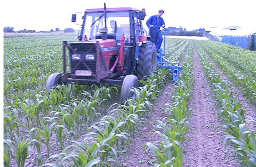
Stade 7ème à 8ème FV