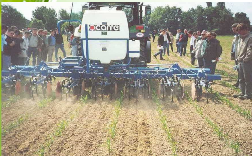
Stade 3ème à 4ème FV